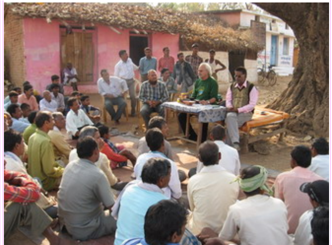
Kabirdham Dorf, Kuthu District