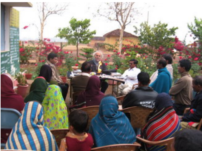
Aheri Dorf, Dist. Durg