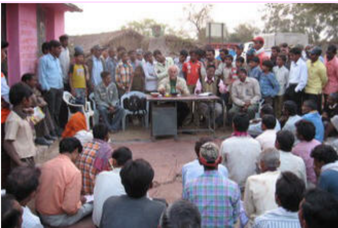
Dorf Kothar, Dist. Tahsil Kwardha