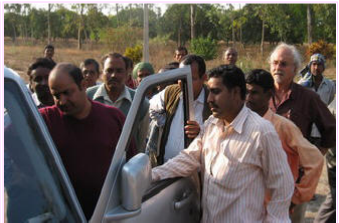
In Mohan Bhata, Bilaspur wurden die Lautsprecher eines Autos benutzt, um ein Video über Homa Therapie im Computer zu zeigen.