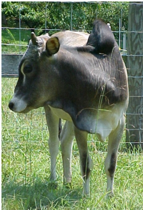
Homa Kühe und ihre Milch wurden nicht von der Radioaktivität in Tschernobyl beeinflusst.

Zum Zeitpunkt des Atomkraftunfalles in Tschernobyl im Jahr 1986 hatten wir in Österreich einen Bauernhof auf dem wir Homa Therapie praktizierten. Nachdem die Regierung öffentlich den Unfall mitgeteilt hatte, gab es auch einige Regelungen für die Bauern.