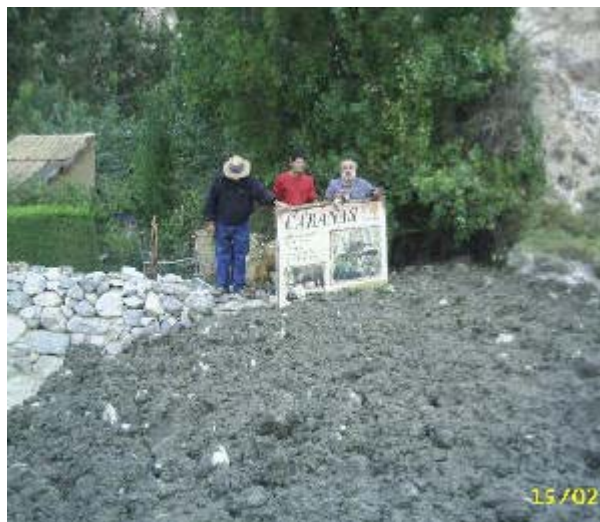
Die Erdlawine hielt direkt vor Albaricoque an und drehte sich dann. Sie hat nicht ein Haar von diesem Grundstück, wo dei Homa Feuer seid über 20 Jahren gemacht werden, beschädigt.

Dann, auf der Seite wo der Schlamm zuerst den Parkplatz und dann die Gästehäuser erreichen hätte sollen, erhob sich eine drei Meter hohe Wand aus Schlamm, welche stillstand. Sie berührte nicht