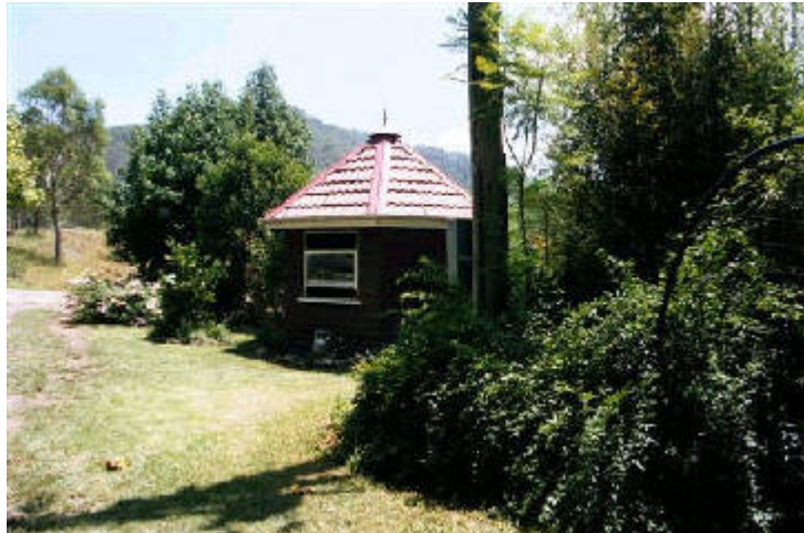
Feuerhütte von Om Shree Dham, wo täglich zu Sonnenauf- und -untergang Agnihotra praktiziert wird.

Sub-Artesisches Wasser wurde in einer Tiefe von 33 Metern gefunden. Es wurde im Laboratorium getestet und als SEHR SALZHALTIG UND ALKALISCH bewertet. So gab es hier also eine Gelegenheit zu sehen, was Homa Therapie vollbringen kann. Wir machten das AGNIHOTRA am Brunnen und gaben regelmäßig die AGNIHOTRA ASCHE hinein. Das staatliche Wasserministerium überprüfte regelmäßig alle