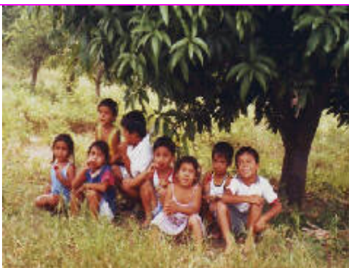
Frohe und gesunde Kinder auf einem Homa Bauernhof

Sehen wir nun die andere Seite. Szene B. Hier sehen wir eine Zunahme an :