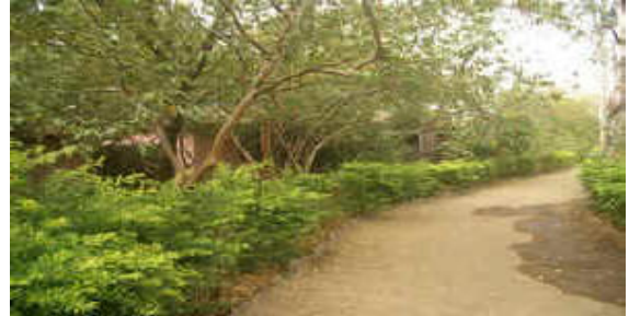
Derselbe Blickpunkt von Tapovan im Jahr 2007