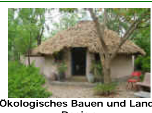
Ökologisches Bauen und Land-Design