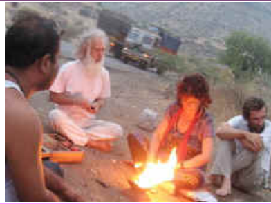
2. Juni, auf dem Weg nach Tapovan, Maharashtra (MH) Morgen Agnihotra am Wegrand