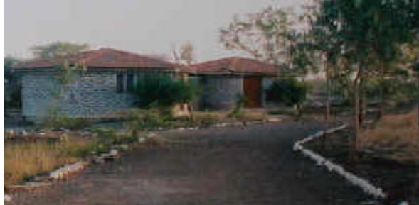
Tapovan im Jahr 1997