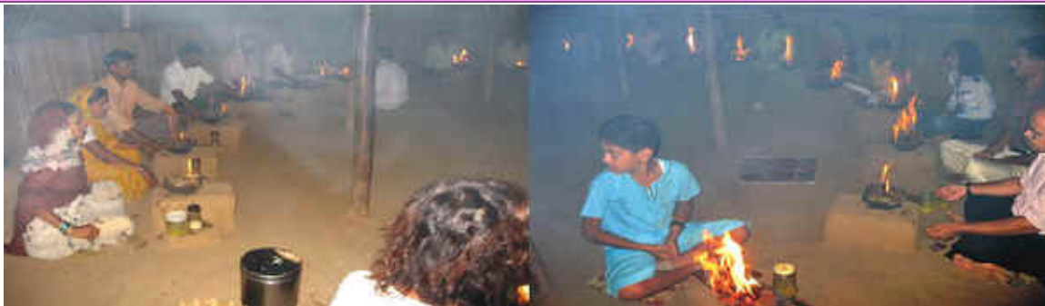
6. Juni, Tapovan, Maharashtra, India Sonnenaufgang Agnihotra mit allen Gästen, die überraschenderweise gestern spät abends ankamen, um mehr über Homa Therapie zu erfahren. Abendessen und Betten in den kühlen Tonhäusern erwarteten sie. Es sind Großfamilien und jeder will sein eigenes Agnihotra Feuer machen. Auf diese Weise gibt es oft auch sehr viele Agnihotras in der früh, welche den Energiezyklus dieser Umgebung und vieles mehr positiv unterstützt...