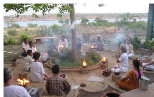
11. Juni, Maheshwar, M.P. Was für ein Segen Maheshwar Goshala betreten zu können, ein spezieller Platz nahe am Narmada Fluß (im Hintergrund). Einer der LICHTPUNKTE auf unserer Erde, von wo aus Heilung auf den ganzen Planeten strömt.