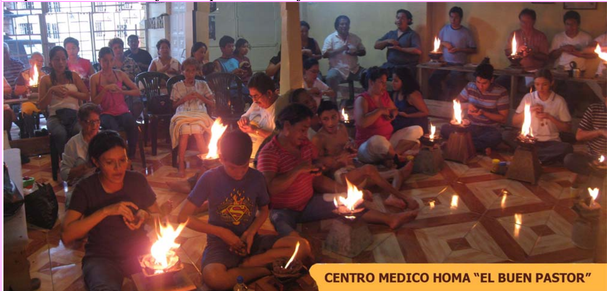
CENTRO MEDICO HOMA "EL BUEN PASTOR"

respuestas aclaratorias y todos quedamos muy contentos! (foto arriba)