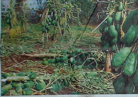
■ पारोळा तालुक्यातील वसंतनगर शिवारात उदधस्त झालेली पपईची बाग.