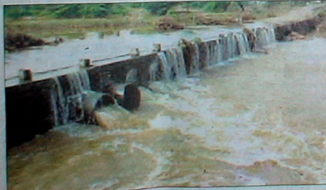
■ जोनदार पावसापळे बहादरपूर परिसरातील नदी-नाल्यांना पूर आले.