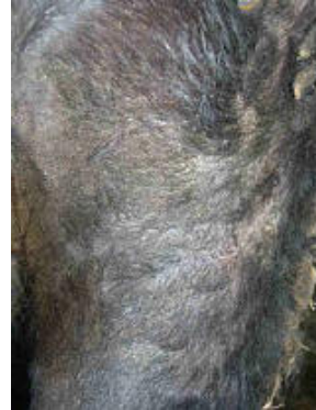
Imagen 2, Día 2 del Tratamiento con la ceniza de Agnihotra: la inflamación ha desaparecido completamente y los signos de picazón también. Las heridas abiertas se sanaron completamente. El tratamiento se continuó un día mas para asegurar la sanación total.

El caso de "Dulce Domingo": Imagen 1: una vaca de 8 años ha sufrido de irritación crónica a la piel todos los años cuando era llevada al establo durante los meses de invierno. Los tratamientos en el pasado han sido largos y sin mucha efectividad. En el invierno del 2005 comenzamos el tratamiento con la ceniza de Agnihotra y el Ghee. Esta fotografía muestra claramente la extensión de la irritación y el daño en la piel.