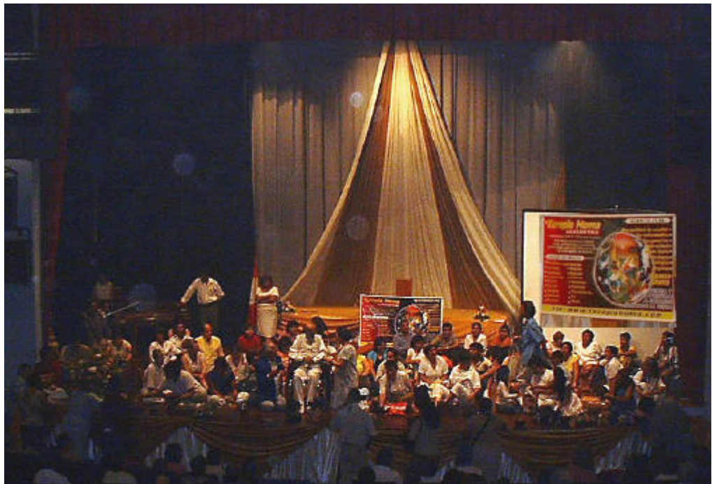
Festival HOMA en la Universidad Nacional de Piura donde mas de 140 pirámides fueran encendidas para el Agnihotra de la puesta del sol y mas de 700 personas participaron. experimentaron este "Milagro de AMOR". (¿Puede Ud. ver los círculos de LUZ?)