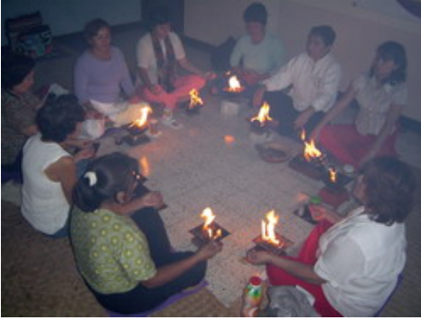
Los Círculos de Sanación de Mujeres con los Fuegos Homa fortalecen la hermandad.