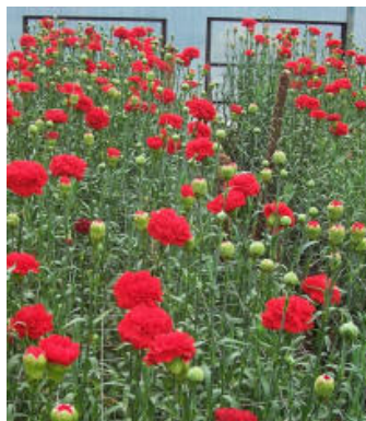
Foto a la izq.: Claveles sanos y brillantes tratados con Agnihotra en el invernadero de la Universidad.