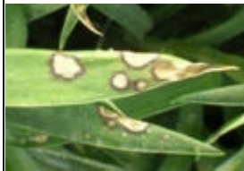
y manchas foliares