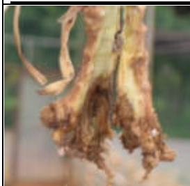
Raiz dañado con el Fusarium