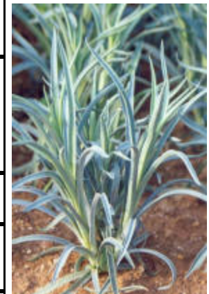
Claveles sanos con tratamiento Agnihotra