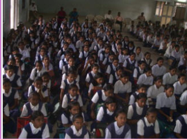
Colegio Secundario Mahila Mandal Chopda, Distrito Jalgaon, Maharashtra