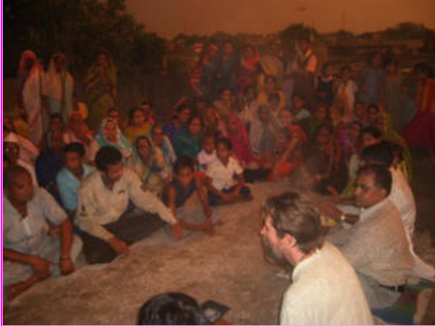
Dharangaon, Distrito Jalgaon, Maharashtra