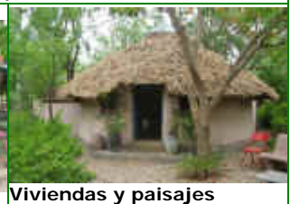
Viviendas y paisajes ecológicos