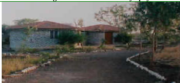
Tapovan en 1997

Anne es la Madre de Tapovan y todos la llaman "Madam" con mucho amor. Ella esta trabajando con las mujeres en los pueblos cercanos y da trabajo a mas de 500 mujeres a través de una fabricación de artículos caseros y esto lo hace con una gran actitud de servicio y apoyo a todas las hermanas.