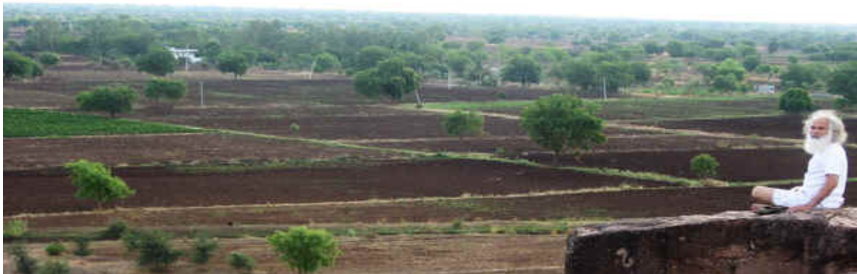
"Tapovan" y las granjas alrededor justo antes del comienzo de las lluvias del Monzón.

Granja Homa "Tapovan", Distrito de Parola, Jalgaon, MH, India