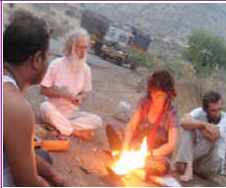
2 de Junio, en el camino a Tapovan, MH Agnihotra de la salida del sol a lo largo del camino