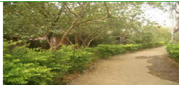
Misma vista de Tapovan en 2007