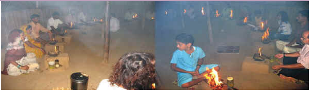
6 de Junio, Tapovan, Maharashtra, India Agnihotra de la salida del sol con visitantes que llegaron inesperadamente la noche anterior. Ellos fueron recibidos con cenas y se quedaron en las bellas cabañas, construidos para este propósito. Estas familias y sus muchos miembros quieren practicar el Agnihotra. Así muchos fuegos sanadores son encendidos diariamente para apoyar el ciclo energético en esta área y mucho más....