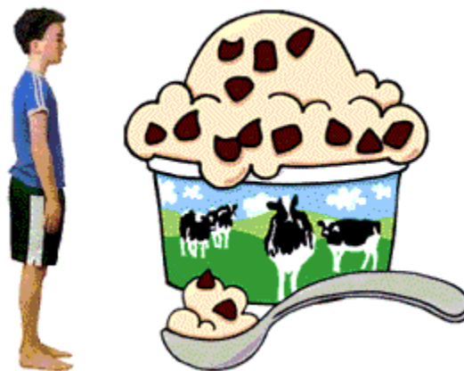
TAPA ajuda a controlar a gula.

Agora, vamos nos concentrar na gula (comer em excesso). Na verdade, o auto-estudo nos leva a uma situação que a maioria das pessoas enfrenta num momento ou outro: têm fome e são colocadas diante de uma quantidade enorme de pratos deliciosos. Quanto vai comer?